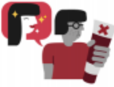
ดูจึงให้เข้าใจผิด