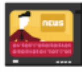
แทนแสดงข้อมูลหรือข้อความเกิน 1 ใน 8 ของหน้าจอ