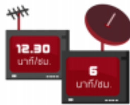
โฆษณายาวเกินกว่าระยะเวลาที่กฎหมายกำหนด