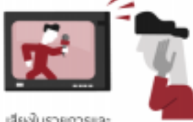
เสียงในรายการและโฆษณาดังต่างกันจนนำรบกวน